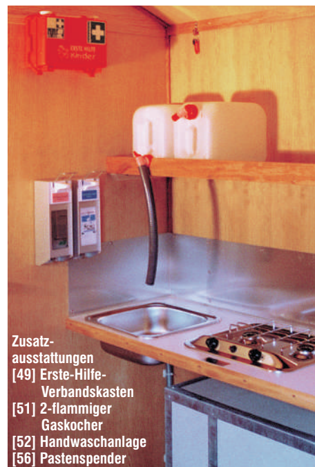
Zusatzausstattungen [49] Erste-Hilfe-Verbandskasten [51] 2-flammiger Gaskocher [52] Handwaschanlage [56] Pastenspender