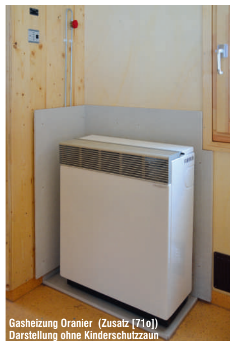
Gasheizung Oranier (Zusatz [71o]) Darstellung ohne Kinderschutzzaun