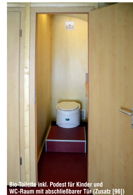
Bio-Toilette inkl. Podest für Kinder und WC-Raum mit abschließbarer Tür (Zusatz [96])