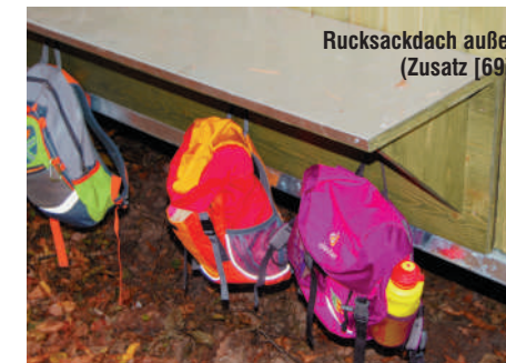
Rucksackdach außen (Zusatz [69])