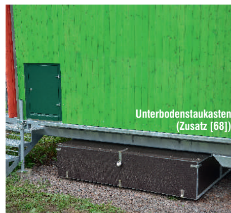
Unterbodenstaukasten (Zusatz [68])