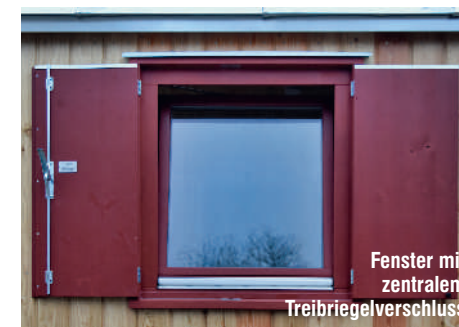
Fenster mit zentralem Treibriegelverschluss

Bitte beachten Sie auch unsere neue Internet-Seite unter www.waldkindergarten-wagen.de